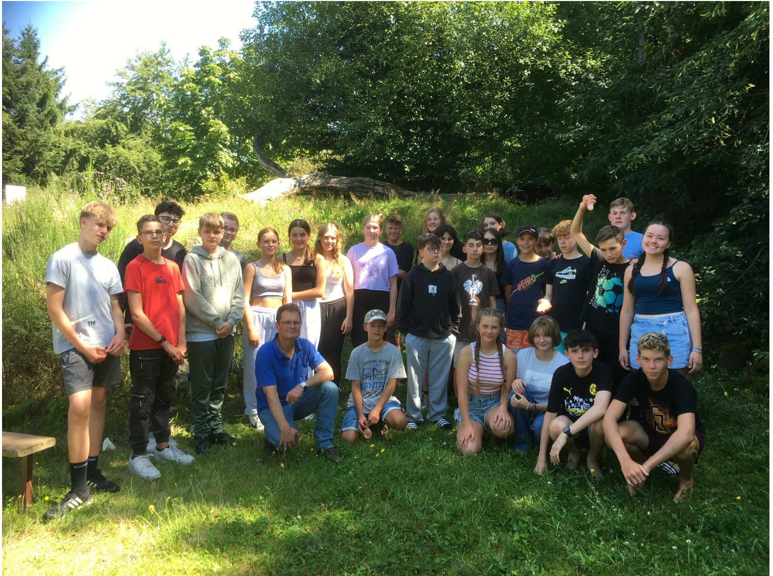
Anfangsfahrt der Klasse 9